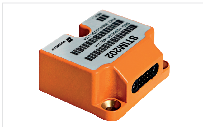
Рис. 1. Внешний вид гироскопа STIM202

кристалла кремния. Принцип действия приборов, основанных на технологии Butterfly, такой же, как и у других вибрационных гироскопов. Специальная система возбуждает первичные противофазные колебания инерциальных масс (рис. 2). Если происходит поворот гироскопа, то под действием силы Кориолиса инерциальные массы смещаются в направлении, перпендикулярном плоскости первичных колебаний (см. рис. 2). В результате возникают вторичные колебания, частота которых совпадает с частотой